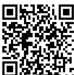
本學期開課科目查詢